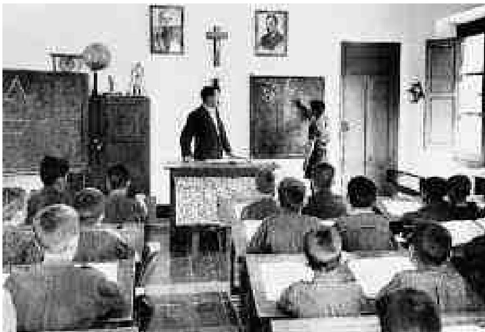
A escola franquista e os valores do rexime

O profesorado acordará coa clase unhas preguntas para entrevistar persoas que desexen colaborar cun traballo escolar ao redor da vida baixo a ditadura franquista: a represión, a falta de liberdades, cuestións da vida diaria, etc. As entrevistas, transcritas ou en formato audiovisual, poden ser acompañadas por fotografías antigas, imaxes de obxectos significativos cunha breve descrición... Todo o material resultante da experiencia pode ser hospedado nun Google Site ou similar, sobre a memoria recente do teu Concello en relación a esta temática.