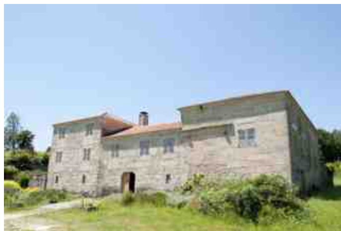
Pacto de Lestrobe asinado no pazo da Ermida (Dodro)

O inicio de 1930 marcou unha mudanza no rumbo político: Primo de Rivera abandonou o poder por causa da retirada de apoio de Alfonso XIII. A oposición social que exerceran intelectuais, estudantes, sindicatos e grupos nacionalistas xerou unha gran influencia. Na Galiza foi relevante a celebración, en marzo dese mesmo ano, do Pacto de Lestrobe (Dodro-A Coruña) que aglutinou boa parte do republicanismo galego na Federación Republicana Galega (FRG). Esta organización política, republicana, de esquerdas e inicialmente federalista, escolleu a Santiago Casares Quiroga, líder da Organización Republicana Galega Autónoma (ORGA), para comparecer meses máis tarde nunha asemblea no País Vasco.