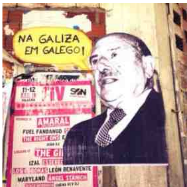
Carvalho Calero, compromiso co futuro da lingua

A BD mostra de inicio a fin o compromiso de Carvalho Calero cunha visión extensa para a lingua galega. No desenvolvemento da historia vémosto a expor o seu punto de vista sobre a relación entre galego e portugués aos seus compañeiros do Seminario de Estudos Galegos, e a lembrar que xa desde o Rexurdimento, o Galeguismo tiña reflectido sobre ese mesmo asunto ( https://carvalhocalero2010.net/citacoes/ ). En segundo lugar, podemos ver o peso de Constantino García e a alianza ILG-RAG para a aprobación da normativa vixente. Tamén observamos a exclusión progresiva de Carvalho Calero dos círculos académicos e culturais, por compartir con Rodrigues Lapa unha perspectiva reintegracionista para o galego, é dicir, a aproximación ortográfica ao portugués. E xa por último, vemos un Carvalho Calero a expor unha visión madura sobre a cuestión, na presentación do seu traballo Problemas da Lingua Galega (1981) así como no Primeiro Congreso Internacional da Lingua Galego-Portuguesa na Galiza (1984).