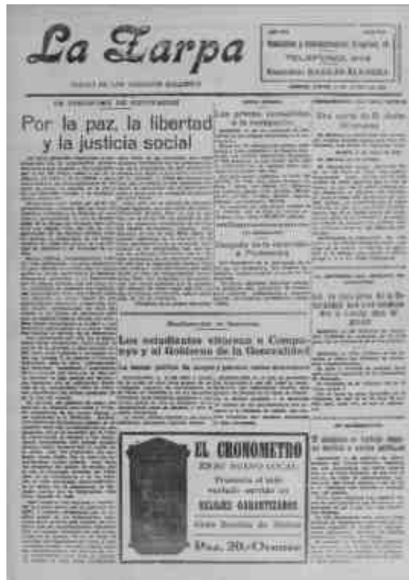
Principal periódico do Agrarismo

O pano de fondo destas transformacións foi a Restauración Borbónica baixo o reinado de Alfonso XIII, perpetuador da alternancia no poder dos dous grandes partidos liberais, iniciada no final do século XIX, e xa en decadencia. A súa desatención a certos problemas de desigualdade e de inxustiza social, ben no campo ben na cidade, contribuíu a que o pobo canalizase as súas distintas sensibilidades e inquietudes, mediante diferentes partidos políticos e sindicatos, formacións como as Irmandades da Fala ou as sociedades agrarias.