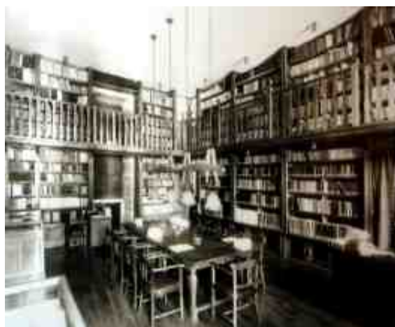
Biblioteca do Seminario de Estudos Galegos

A política cultural do Seminario coidaba da aproximación cultural galega e portuguesa apoiándose nos vínculos lingüísticos a un lado e outro do Miño. Por tanto, intelectuais de ambas as beiras, publicaron na revista Arquivos e organizaron eventos culturais conxuntamente. Durante os seus trece anos de vida, o SEG promoveu a investigación colectiva a través das súas seccións e dunha política cultural de ampla proxección, que conseguiu prestixio dentro e fóra da Galiza.