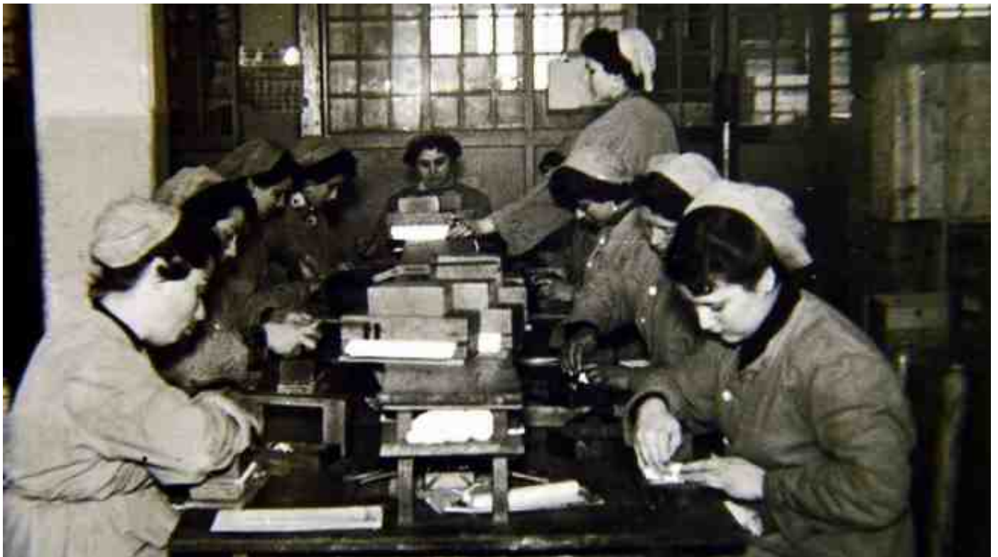
Traballadoras da Real Fábrica de Tabacos da Coruña

Na BD (pp. 26-27) vemos a Chéli e a Carvalho Calero a xogar nunha praza ferrolá cando se encontran cunha protesta de traballadores e traballadoras a berrar proclamas a favor da loita obreira. Todo isto acontece en 1923, despois do golpe de estado de Primo de Rivera co beneplácito da monarquía. A partir de aquí, dará inicio unha ditadura que marca a década de 1920, e que vai reprimir vivamente este tipo de manifestacións.