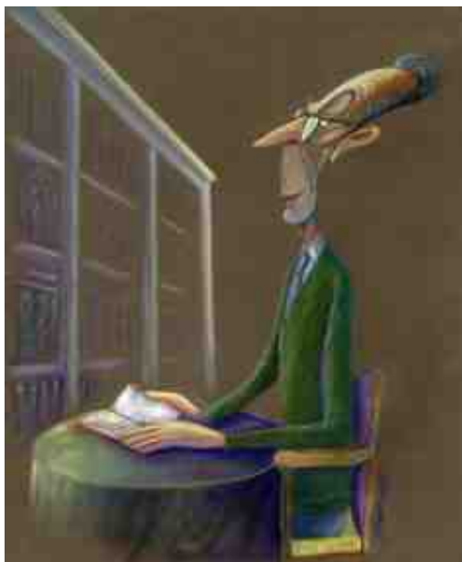
R.Piñeiro sentado na súa mesa camilla, por Siro. 2009

Esta Fotogalería pode ser útil tamén: http://culturagalega.gal/exilio/galeria_castelao.php?gal=1