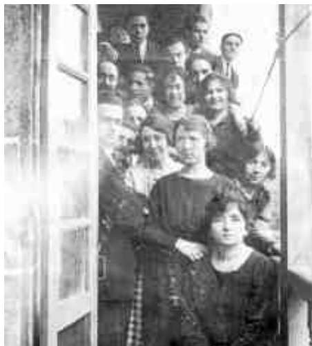
Grupo de teatro da Irmandade da Coruña

En 1926, Carvalho desprázase a Compostela para iniciar os seus estudos universitarios escollendo a carreira de Dereito. A cidade vaille dar a oportunidade de se envolver no activismo cultural e político do momento, comezando polo ambiente estudantil, onde acabará liderando a FUE, Federación Universitaria Escolar.