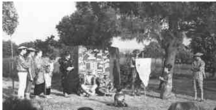
Grupo de teatro no colexio Fingoi

A partir de 1965, Carvalho Calero continuará a súa carreira docente en Compostela no instituto Rosalia de Castro e finalmente na Universidade, onde exerceu a primeira cátedra de Lingua e Literatura Galega desta institución.