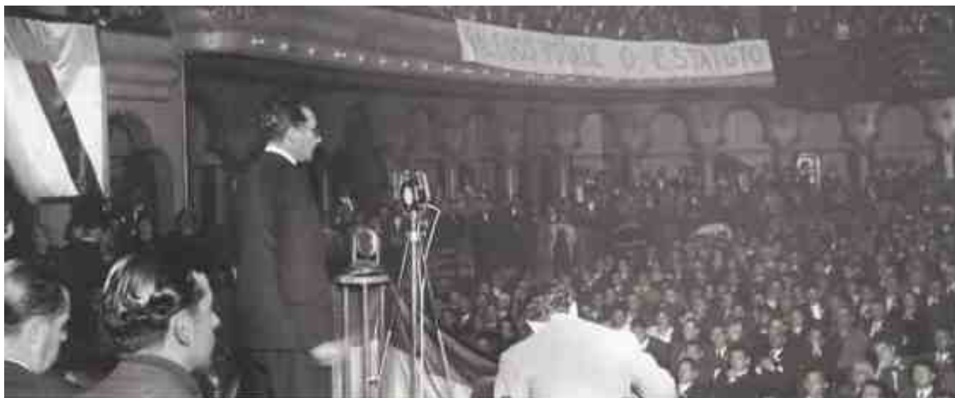
Mitín de Castelao no teatro Alcázar de Madrid a favor do Estatuto. 1936.

https://namorartedegalicia.wordpress.com/2015/07/14/os-carteis-do-estatuto-de-autonomía-de-1936/