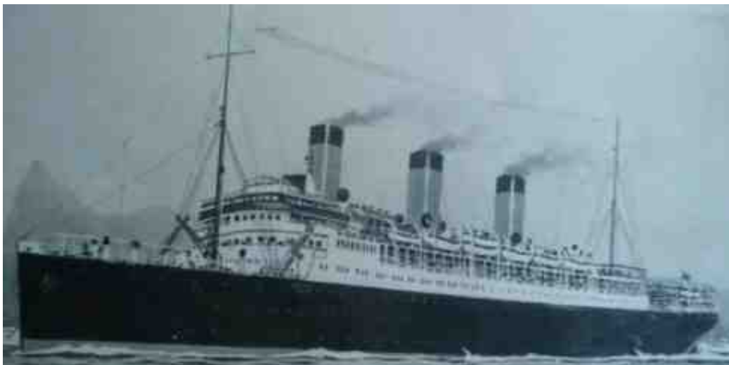
América Latina acolleu o exilio republicano

A información obtida é partillada para reflectirmos sobre os mecanismos de control social que pode ter un réxime político e a importancia da resposta cidadá.