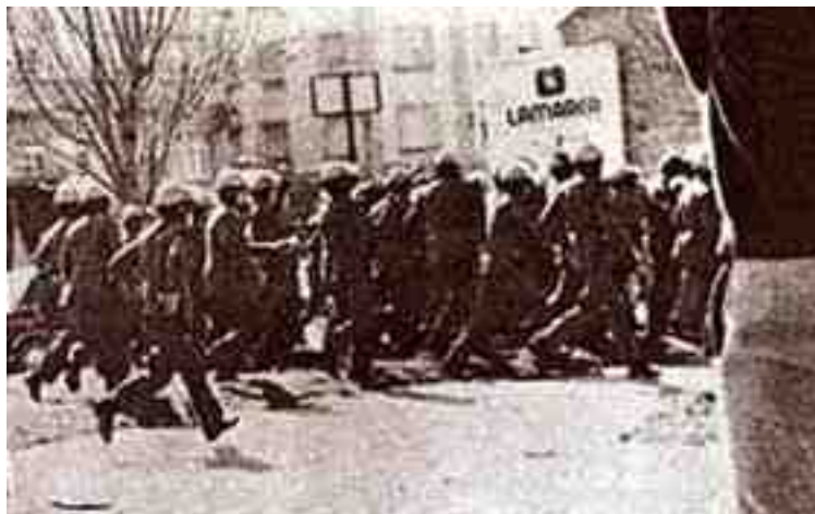
Carga policial durante a folga xeral en Vigo, 1972

https://www.mazarelos.gal/2019/03/17/vigo-1972/