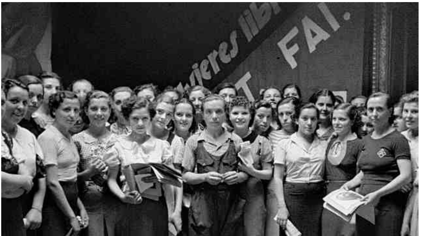
Mulleres antifascistas da Unión de Mujeres Españolas

O inicio da rebelión militar sorprende a Carvalho Calero en Madrid, a onde viaxara para se presentar a un concurso público de acceso ao corpo de catedráticos de Ensino Secundario. Carvalho defendeu primeiro a República en Madrid, despois en Valencia e xa ao final da guerra, en Andalucía. Boa parte destes feitos e o seu compromiso antifascista son mostrados no episodio 3 da BD.