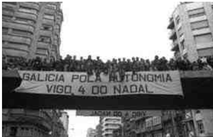
Xornada pola autonomía. Vigo, 1977