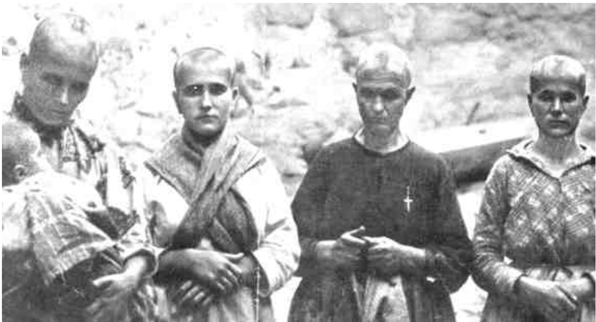
Mulleres represaliadas co cabelo rapado

Podes presentar a túa reportaxe en formato vídeo, por exemplo.